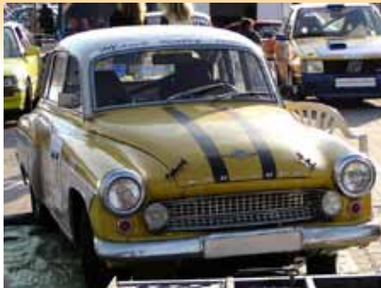
LOS WARTBURG, procedentes de Alemania Oriental, servían de carros "escuela" para muchos de los que nos iniciamos hace años en la mecánica y el automovilismo.