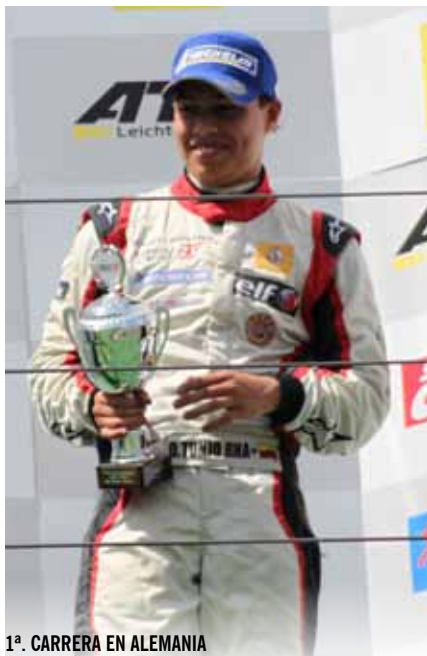
1ª. CARRERA EN ALEMANIA