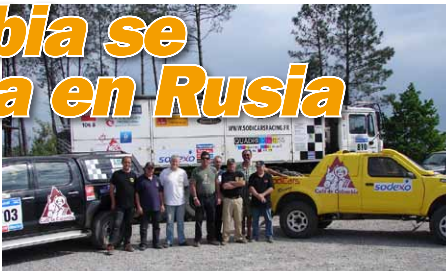
GRUPO DE TRABAJO y competencia del equipo francés Solicars que se alista para el Rally de Rusia.

Lo harán en la Categoría T1 -autos de súper producción modificados-, la que reúne la mayor cantidad de participantes y los más competitivos, a bordo de un prototipo tubular, con motor central V6 de 420 caballos de potencia y carrocería en kevlar.