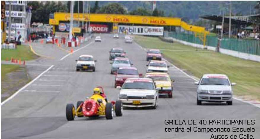
GRILLA DE 40 PARTICIPANTES tendrá el Campeonato Escuela Autos de Calle.