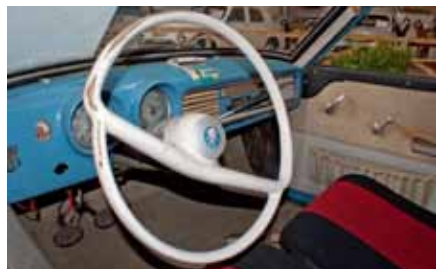
EL INTERIOR de los Wartburg y su mecánica parecían salidos de una historieta de Los Picapiedra.

Como fue mi primera experiencia, la asimile muy bien. Esto me dio ánimo