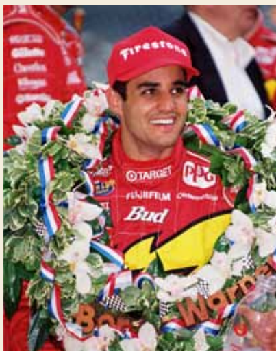
JUAN PABLO MONTOYA, en 2000, el único ganador de habla hispana.